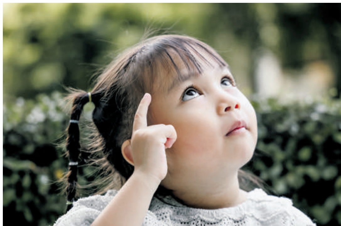
Die Kinder zeigen nach eigenen Bedürfnissen und kombinieren mit der Gebärdensprache.

Und auch Kinder verwenden ihre eigene Sprache, obwohl sie die Zeichen lernen, wie hörende Kinder das Schreiben. «Für mich ist das immer schön», erklärt die Mama von dem Mädchen, die ihre Puppe nun wieder auf dem Arm trägt. «Kinder zeigen nach eigenen Bedürfnissen und kombinieren diese mit den gelernten Zeichen. So suchen sie auch für sich den Namen selbst aus.» Die Mama klatscht zweimal, das Mädchen lacht und